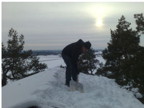
Snöskottning på observatorietaket. Vi hoppas slippa detta denna vintern.....