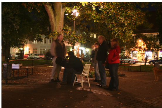
Bild ifrån 2008 år Ljus i Alingsås