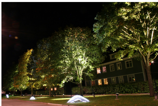
Ett av årets upplysta objekt.

I år går Ljus i Alingsås genom delar av Sörhaga och vi planerar att vara ute några kvällar och visa Månen och Jupiter. Tidigare år har dessa visningar varit mycket uppskattade och det har ofta varit lång kö för att titta i teleskopet.